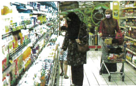
People wearing face masks as they shop at a supermarket in Kuala Terengganu yesterday.

Up to Monday, 18.2 per cent of normal Covid-19 hospital beds, 11.7 per cent of Intensive Care